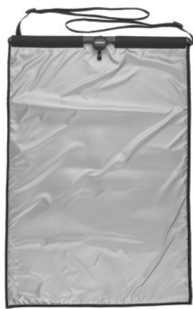
Door Press Pad Model GDPP1