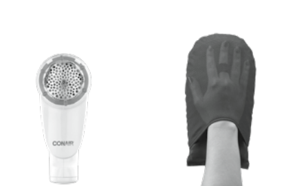
Quitapelusas a pila Modelo CLS1