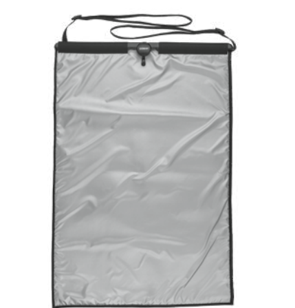
Almohadilla protectora para puerta Modelo GDP1

ACCESORIOS PARA PLANCHAS A VAPOR CONAIR (vendidos por separado)